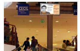
Weitere Indoor-Standorte Tirol: DOB Brenner CYTA Shoppingwelt

Kurzbuchungen Aufschläge: 1 Woche: +25% 2 Wochen: +20% 3 Wochen: +15%